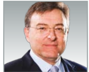
Dr. Norbert Reithofer, Vorsitzender des Vorstands, BMW Group,